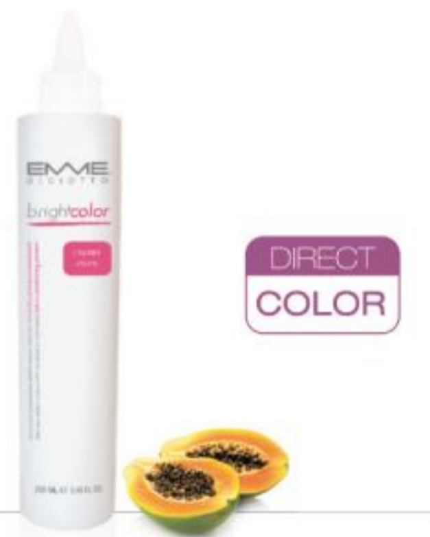
CASTANO SCURO Dark Brown

ДЛЯ ВСЕХ ТИПОВ ВОЛОС: вымыть волосы 01 Every Day Shampoo, удалить избыток воды полотенцем и нанести выбранный оттенок. Для получения естественного блеска время нанесения должно составить не менее 20 минут. Чтобы получить более глубокий оттенок, время нанесения должно составить 20/30 минут, при этом необходимо использовать источник тепла (климазон с программой для окрашивания). Если вы используете фен на протяжении 20 минут, наденьте пластиковую шапочку. Затем дайте волосам остыть в течение нескольких минут, расчешите волосы, ополосните до чистой воды. Затем вымойте волосы 14 Shampoo Colored Hair, нанесите 14 Conditioner Colored Hair, ополосните и сделайте укладку.